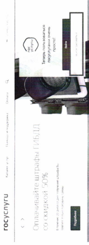
Рисунок 1. Регистрация в информационной системе

Отобразится страница регистрации ЕСИА (рис. 2).