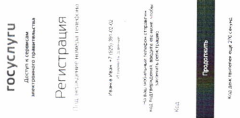
Рисунок 3. Сообщение о необходимости подтверждения номера мобильного телефона

Если выбран способ регистрации по мобильному телефону, то будет отправлено sms-сообщение с кодом подтверждения номера мобильного телефона 1 . Его необходимо ввести в специальное поле, которое отображается на экране (рис. 3). Данный код можно ввести в течение 5 минут (данная информация отображается в виде обратного отсчета секунд), если время истекло, то можно запросить новый код подтверждения номера мобильного телефона.