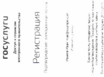
Рисунок 4. Страница подтверждения адреса электронной почты

Если выбран способ регистрации по электронной почте, то отобразится страница подтверждения адреса электронной почты пользователя (рис. 4).